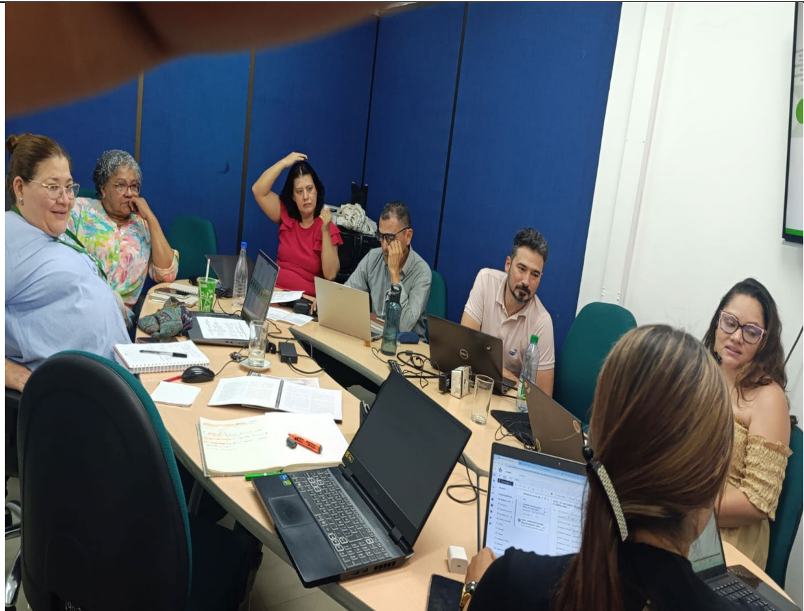
ANEXO 2. Listado de asistencia